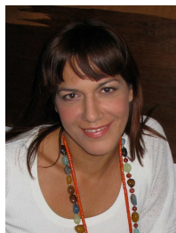
Schulungsleiterin & Dozentin